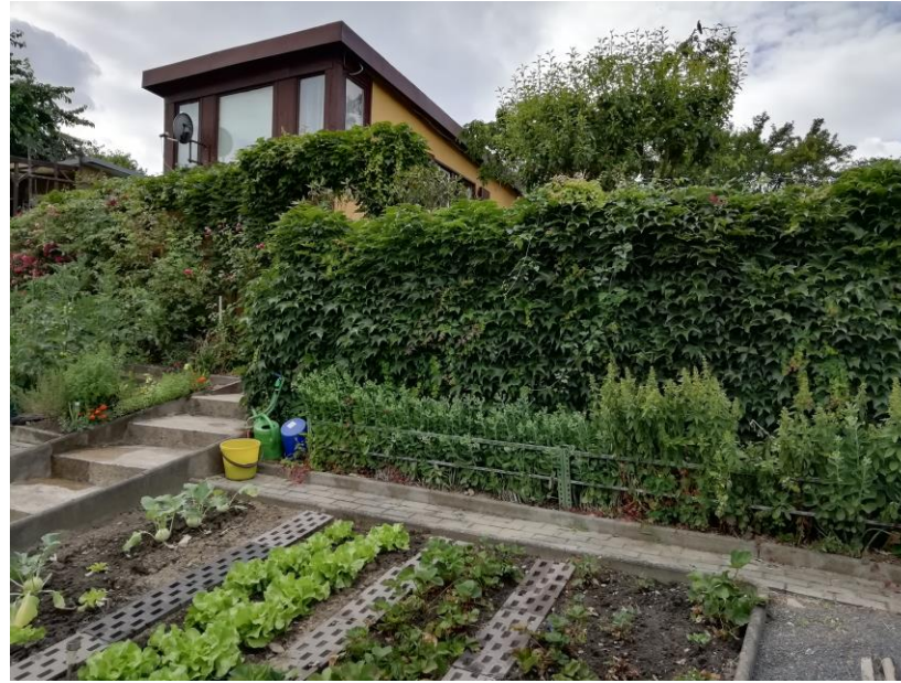
Ansicht Kleingarten Nr. 52 Lageplan

Zugang zum Kleingartenverein Luftbadstr. Tor 1,2 und 5, 9.00- 18.00 Uhr, von April - September.